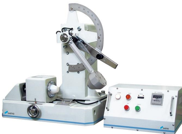
図1 振り子式衝撃発生装置

このような中、当社では産業技術総合研究所との共同研究により、衝撃校正に関わる各種 ISO で規定されている振り子式衝撃発生装置と加速度計測装置の組み合わせにより衝撃校正システムを開発し、これを用いた衝撃校正技術を確立しました。また、ISO/IEC 17025 認定を取得したことで、ILAC・MRA（国際相互承認）のシンボルマーク付き校正証明書を発行することができるようになり、国際的に通用する信頼性の高い衝撃校正サービスを幅広く提供できる体制が整いました。さまざまな衝撃評価試験の信頼性向上へ貢献していくとともに、今後、校正範囲のさらなる拡大と、本技術を活用した衝撃計測関連の新しい製品群とサービスの積極的展開を進めてまいります。