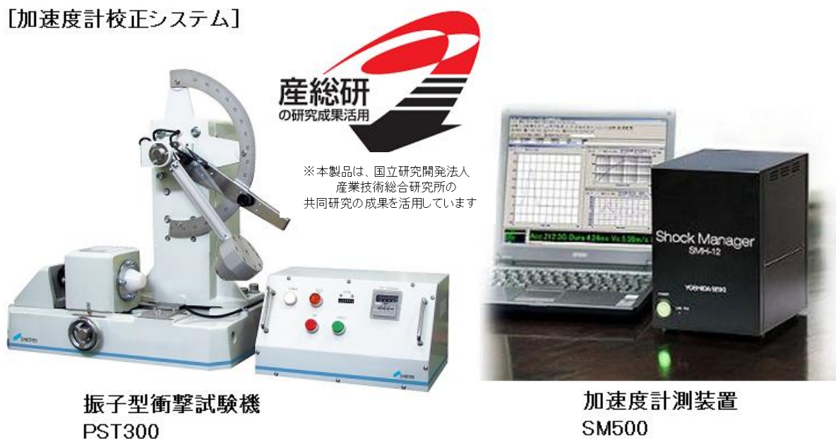
図 4 衝撃校正システム