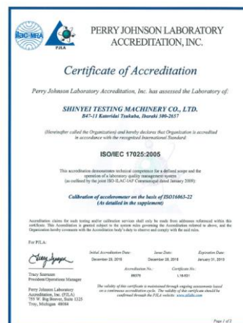
図2 ISO/IEC 17025 認定証明書